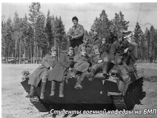
Студенты военной кафедры на БМП