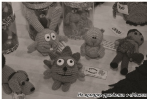
На ярмарке рукоделия в «Макси»