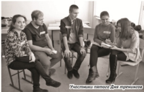
Участники пятого Дня тренингов

4 апреля в 12:00 вновь начнется очередной, уже VII День тренингов. Уже в седьмой раз опытные тренеры в течение четырех часов будут делиться своими знаниями и учить всех желающих новому и «ну очень» полезному.