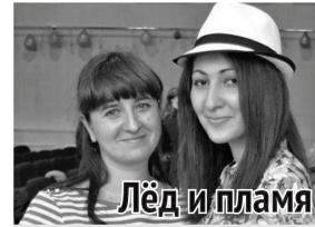
Лёд и пламя

В этом номере наши редакторы со своей традиционной рубрикой оказались в тупике. Тема номера – День Победы, а тут спорить абсолютно не о чем. Ни о важности этого события, ни о целесообразности отмечать его, ни о роли исторической памяти – все должно быть, по нашему мнению, безоговорочно. Поэтому мы просто лишний раз докажем теорему Великой Победы.