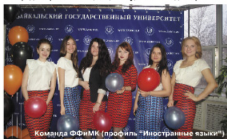
Команда ФФМК (профиль «Иностранные языки»)