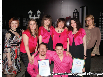
Спортивной группой «Ультра»

работе со студентами, преподавателями и сотрудниками. В состав Спортивно-туристского клуба, а это еще одно направление УВиСР, входит 22 спортивных секции: по футболу, волейболу, баскетболу, легкой атлетике, гиревому спорту, плаванию, спортивному ориентированию, и