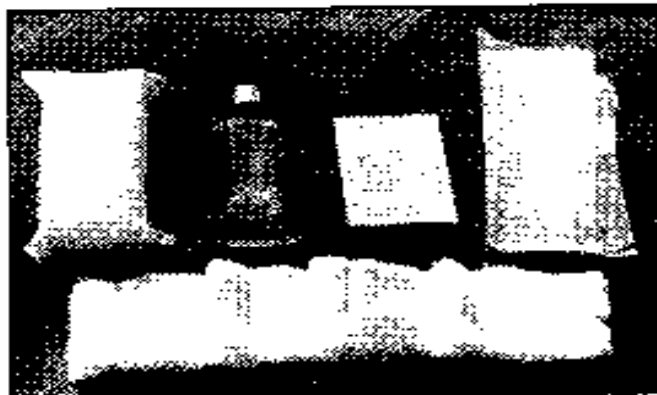
Рис. 17. ИПП-8