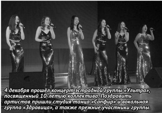
4 декабря прошёл концерт эстрадной группы «Ультры», посвященный 10-летию коллектива. Поздравить артистов пришли студия танца «Сапфир» и вокальная группа «Здравница», а также прежние участники группы.

За 10 лет существования коллектив стал постоянным лауреатом Забай-