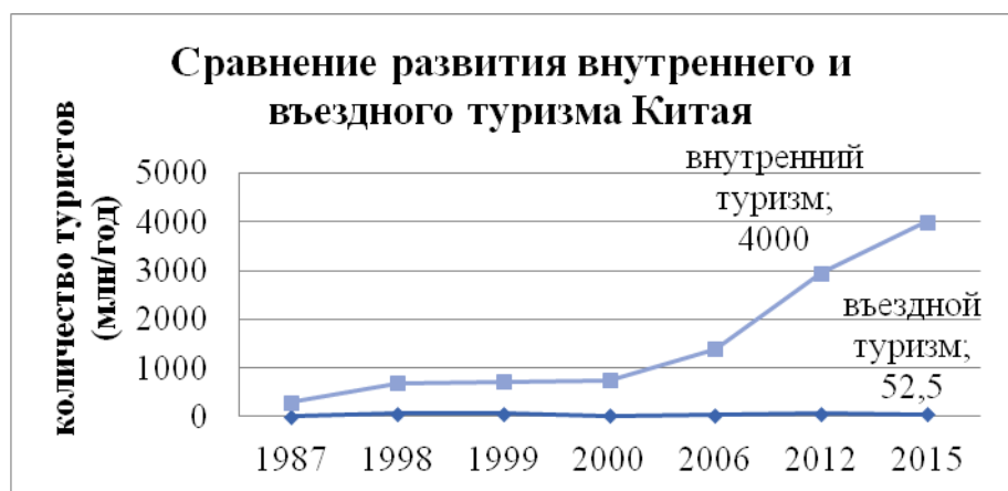
Рис 1. Сравнение развития внутреннего и въездного туризма Китая

Как известно, развитие связей, в том числе и в области туризма, часто развиваются с соседними странами. Не является и исключением и Россия с КНР. Начиная с 2002 года, связи в области туризма между двумя странами регулируются на всех уровнях. Большое значение в этом играет такая организация, как Туристической ассоциации «Мир без границ» [10].